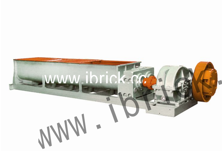
Оборудование в рабочем состоянии

Сырьё после дробления размещивается в смесителе, в то же время добавив воды, чтобы влага достаточно высыхает. Достаточно перемешивается 2 или больше материалы. Данное оборудование применяется для перемешивания сырья как глины, сланец, угольные отходы, шлак и т.д. после дробления.