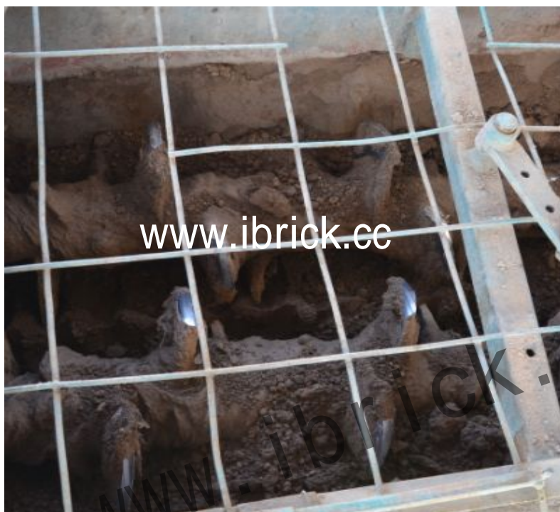
搅拌齿对原料进行搅拌