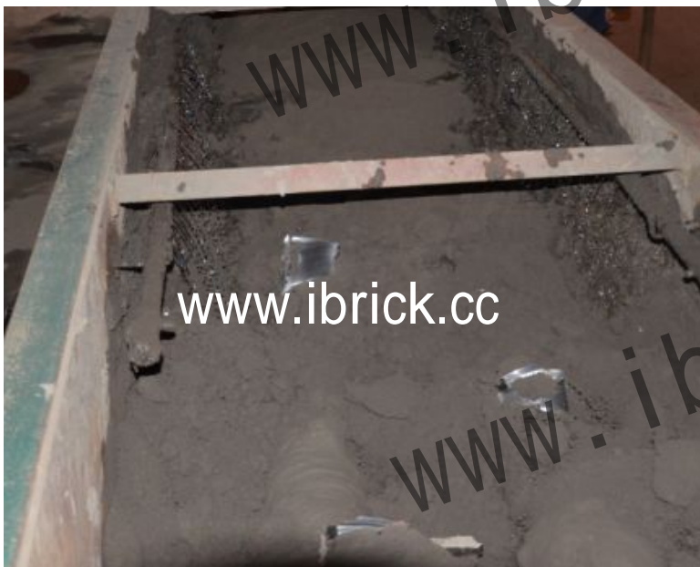
搅拌齿对原料进行搅拌