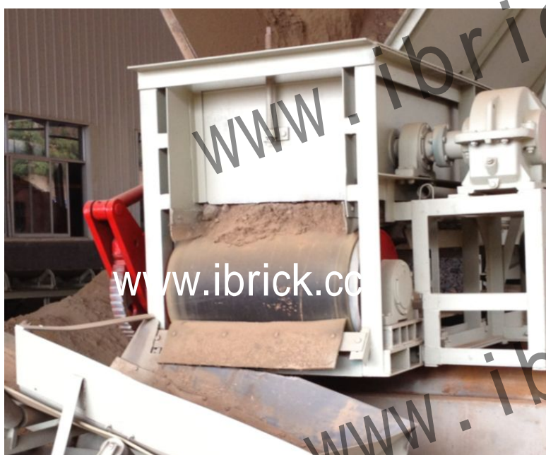
主动滚筒带动皮带实现不断给料