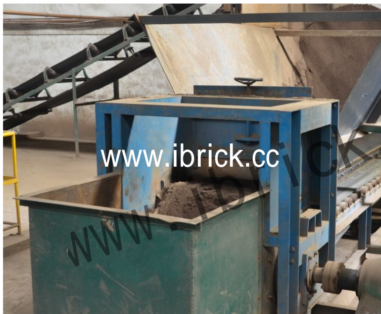
给料口的挡板可实现单位时间给料容量