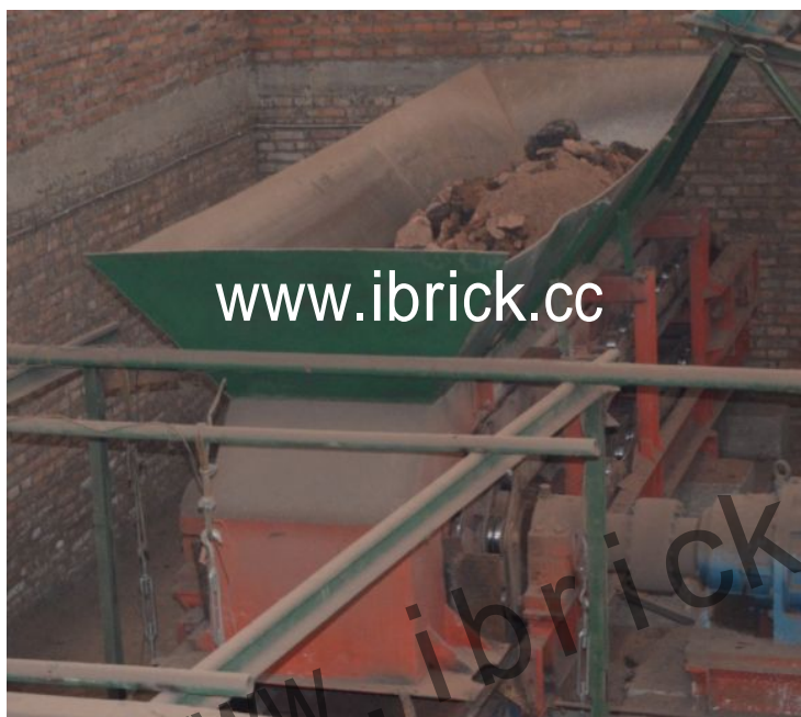
通过转动的铝板实现原料供给