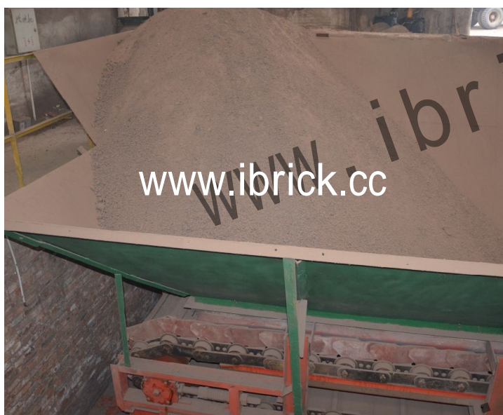
对原料有短暂存储功能